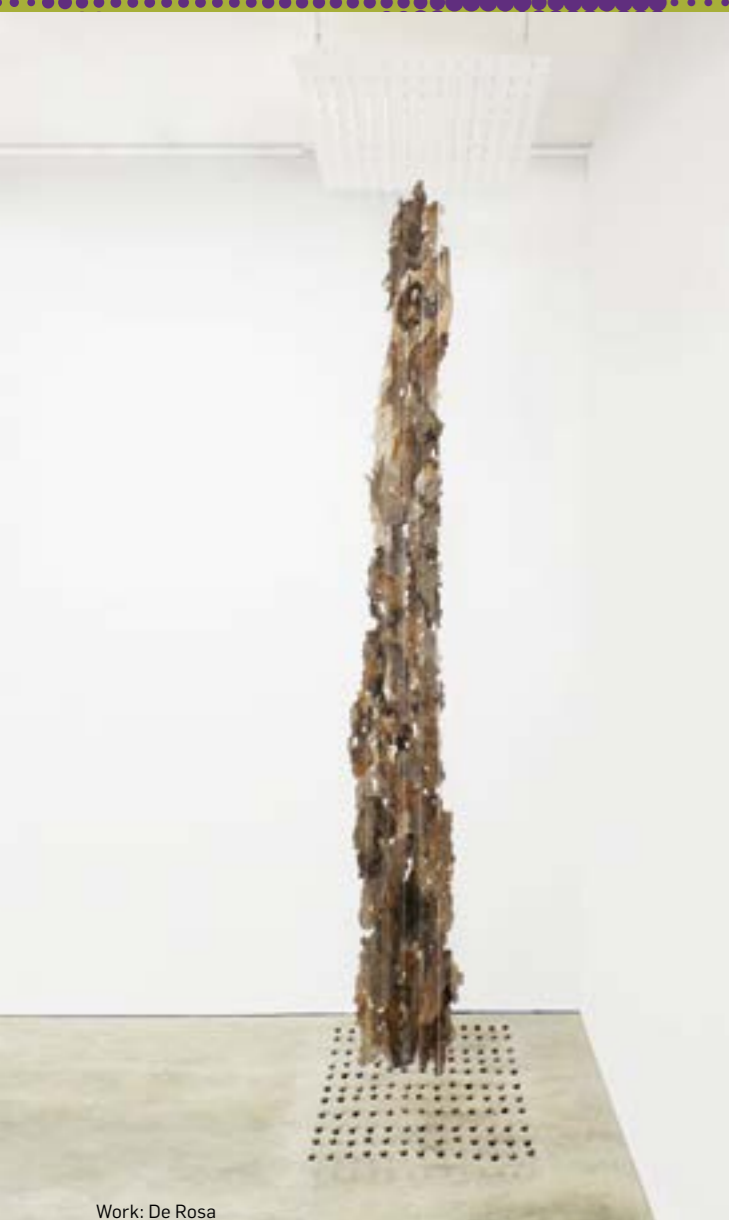
Work: De Rosa